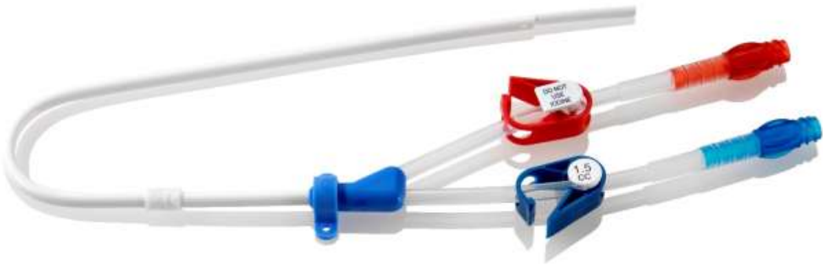
Figura 2: Hemo-Cath® LT dritto