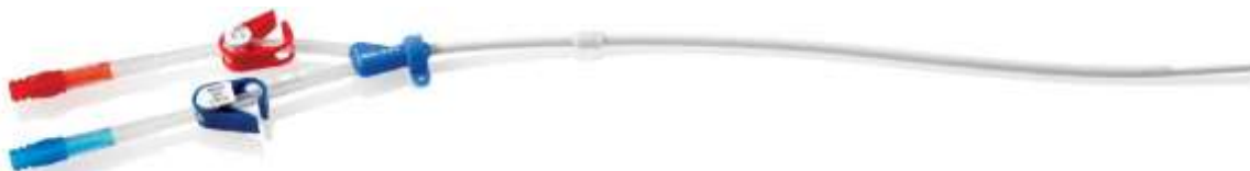
Figura 2: Hemo-Cath® LT dritto