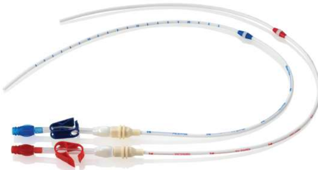
Фигура 1: Катетър 6,5F Tesio