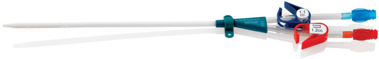
Şekil 1: Duo-Flow® Kateter