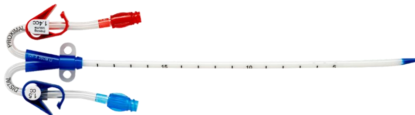
Figura 2 - 12F/14F Catetere Duo-Flow® Side x Side (estensioni curvate)