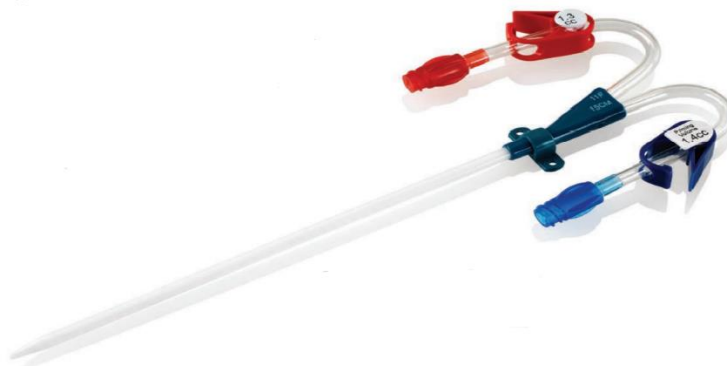
Figura 1: Catéter Duo-Flow® Side × Side de 9F/11F (extensiones curvadas)