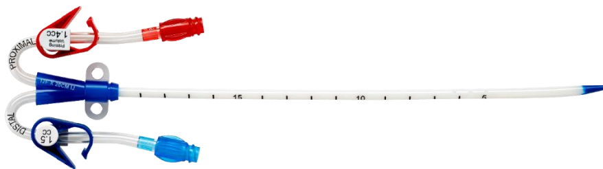
Figura 2: Catéter Duo-Flow® Side x Side de 12F/14F (extensiones curvadas)