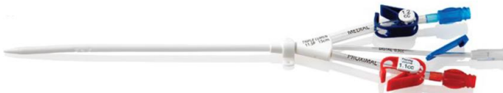
Figura 1: Catéter Tri-Flow (extensiones rectas)