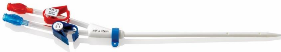
Εικόνα 1 - Καθετήρας Duo-Flow® 400XL® (ευθύγραμμος)