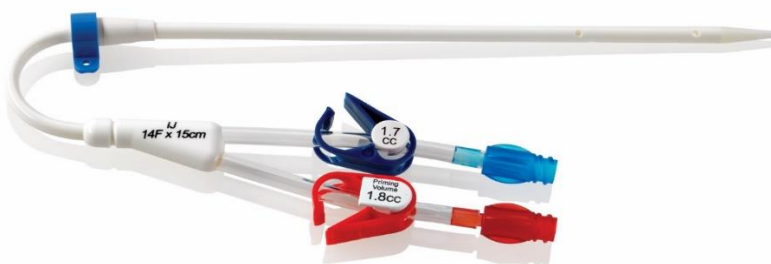
Εικόνα 2 - Καθετήρας Duo-Flow® 400XL® (προσυσπειρωμένος)