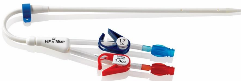
Εικόνα 2 - Καθετήρας Duo-Flow® 400XL® (προσυσπειρωμένος)